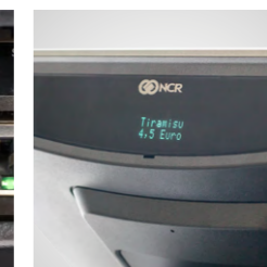
elegant integrierter 2x20 Zeichen Kundendisplay (optional)