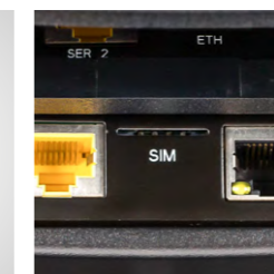
mit Signaturkarten-Slot für die neuen Kassensicherheits-Verordnungen (länderspezifisch/optional)