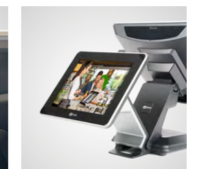
Kundendisplays in verschiedenen Ausführungen (optional)